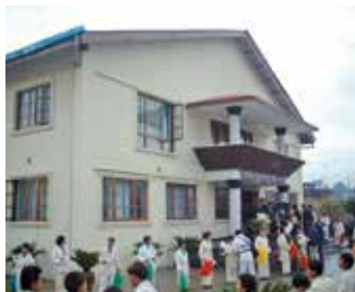
姉妹提携10周年を記念して建てられた武道館