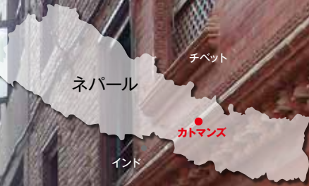
カトマンズ市の路地裏