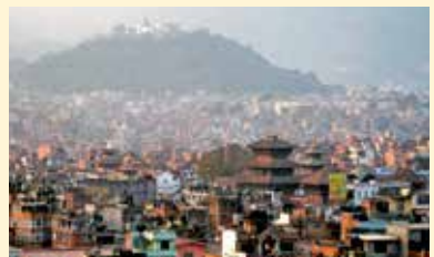
カトマンズ市街の眺望