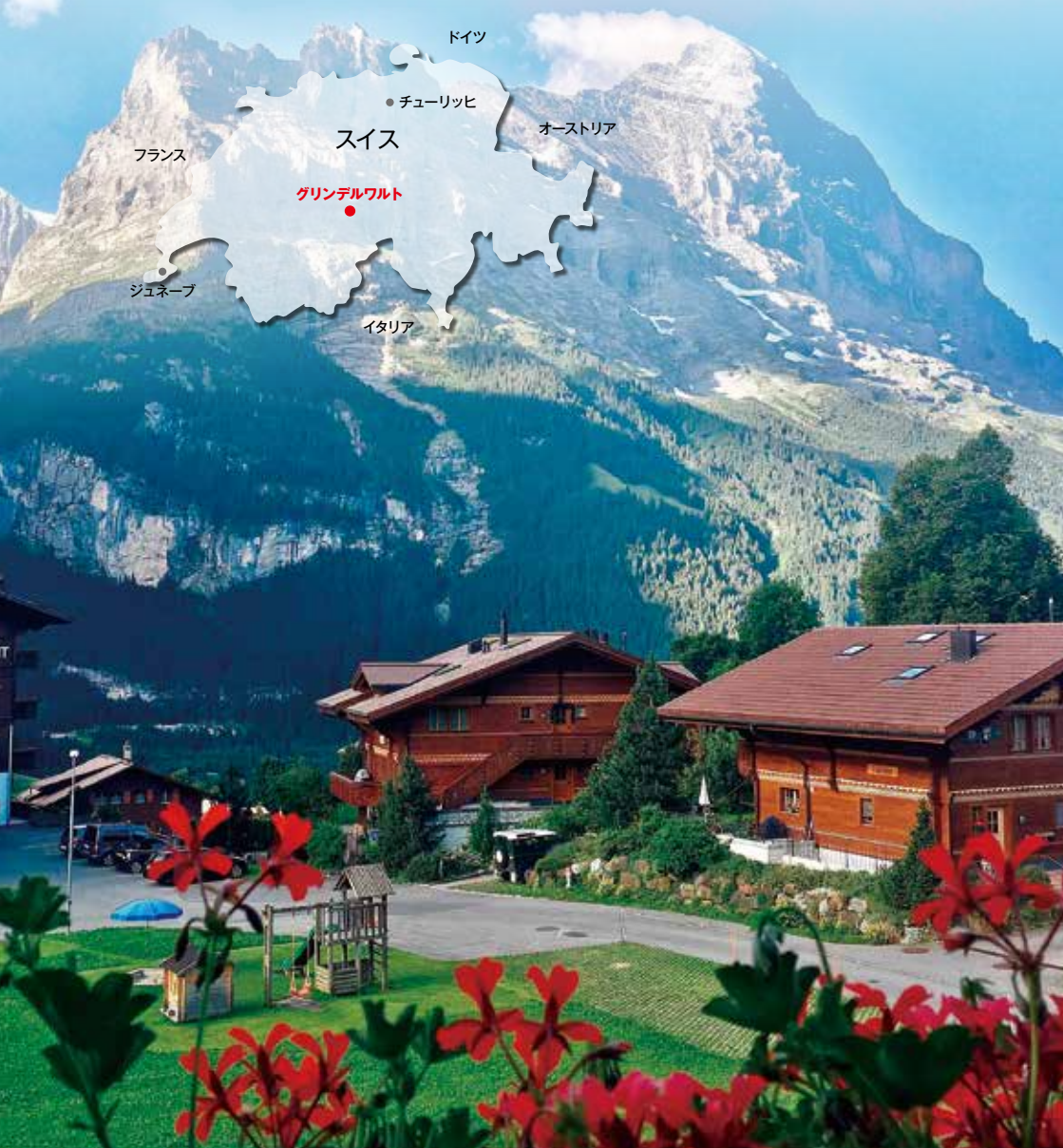
グリンデルワルト村から望むアイガー