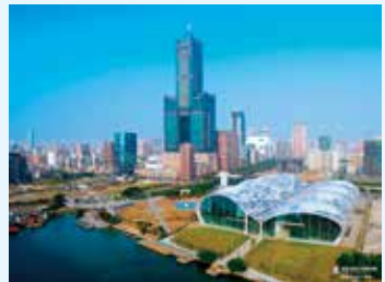
高雄市のシンボルである高雄85ビル