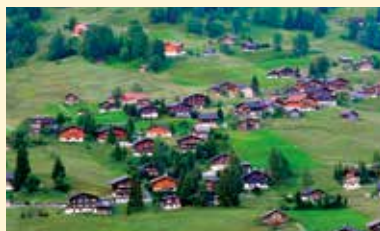
グリンデルワルト村