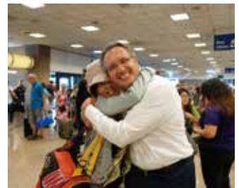
再会を喜ぶホストファミリー