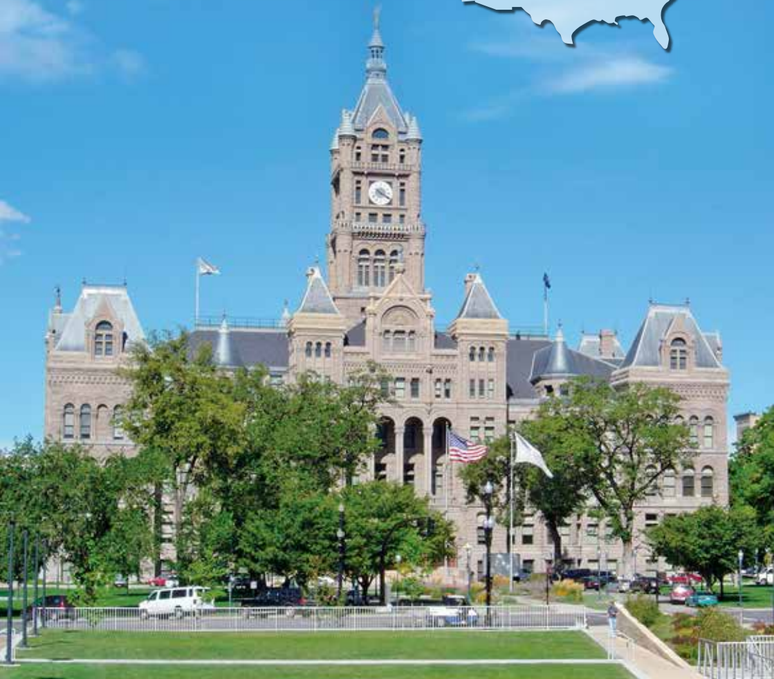
ソルトレーク市庁舎