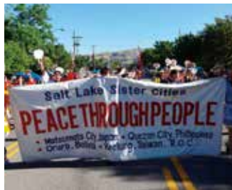
パイオニア(開拓者)パレード