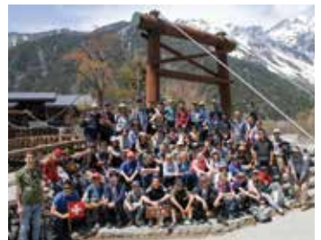
上高地を訪れたグリンデルワルト村の中学生(2019)