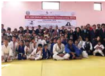
武道館にて開催された柔剣道大会の選手たち(2019)