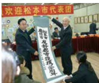
友好提携20周年 第二中学校訪問 (2015)