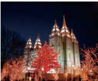
末日聖徒イエス・キリスト教会の神殿