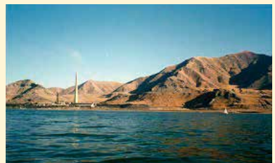
グレートソルトレーク