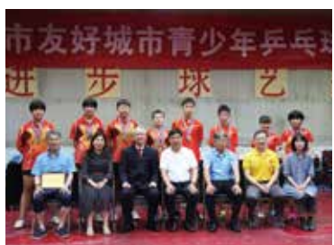
日中友好都市中学生卓球交歓大会 (2019)