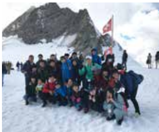
中学生ホームステイ事業(2018)