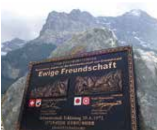
両市の友好関係を示す銘板