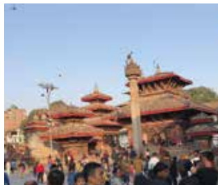
ジャガナート寺院(ダルバル広場)