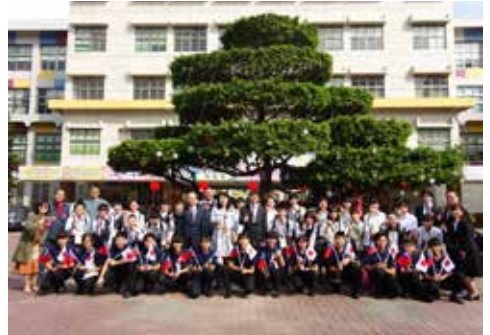
2020.1.7 高雄市立大仁国民中学校を訪れた松本市教育訪問団