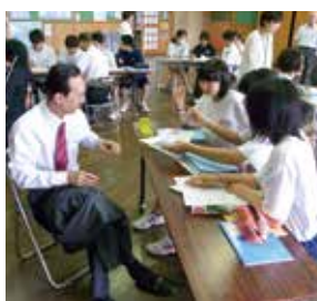
廊坊市教育訪問団が清水中学校へ訪問 (2012)