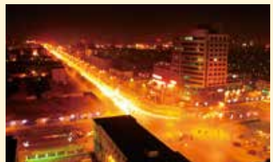
廊坊市の夜景