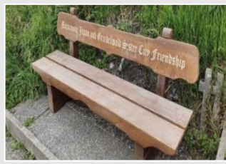
海外都市交流委員会 設置したベンチ

海外都市交流委員会スポンサーのベンチ(グリンデルワルト村観光局及び建設部門の共同事業)が設置されました。設置場所は、テレッセンヴェーグというメインストリートの一つ上にある眺めの良い散歩道です。グリンデルワルトを訪れた際は、会員の皆様も是非実際に座って美しい山々を眺めてみてはいかがでしょうか。