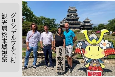
グリンデルワルト村 観光局松本城視察