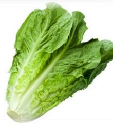
ろめいんれたす ロメインレタス