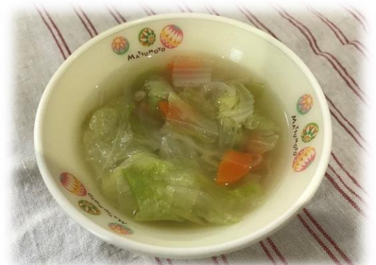
れたすすうぶ レタススープ