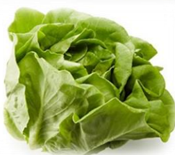
さらだな サラダ菜