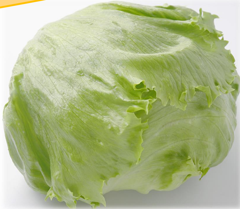
れたす さまざまなレタス