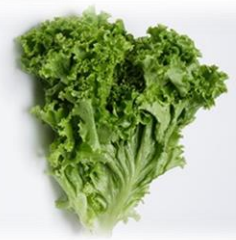
ぐりいんかある グリーンカール

なつば ながのけんさん れたす でまわ これから夏場にむけて、長野県産のレタスが出回