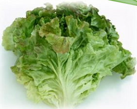
さにいれたす サニーレタス