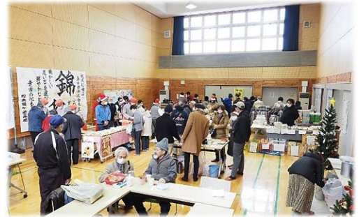
▲白板地区クリスマス・マルシェ

新型コロナウイルス感染症の動向を見ながら、「白板地区をつなぐ!顔の見える関係づくり」にむけ、3部会それぞれが活動に取り組んできました。子供対象の事業では、感染状況に鑑みやむなく中止した事業もありましたが、主として次のような活動に取り組みました。