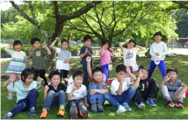
6月2日(木) 小1・2年生 ふるさと公園遠足 この日は夏日！新島々駅まで歩き、そこから庁用車でふるさと公園へ。みんなでたくさん遊びました！

潤い季節6月がやってきました。安曇校では、小学校、中学校とも、学校や学年の行事がおこなわれています。遠足でふるさと講演や上高地に出かける学年、オンラインを通しての学習や集会、学校に講師をお招きした学習会等々、地域に触れたり、地域や学びにゆかりのある方々をお迎えしたりしての学習がはじまりました。机上から離れ、実際に見たり、聞いたり、触れてみたり…の五感を総動員し、地域のよさを味わったり、人々の熱意に触れる中から、みずみずしい生きた学びを体得してほしいと願っています。