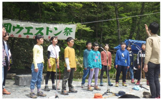
6月5日(土) 上高地 ウエストーン碑前祭参加

3年ぶりのウエストーン碑前祭！小学校4～6年生が参加をし、元気いっぱいの天使の歌声を捧げました♪