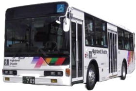
スカイランドきよみず