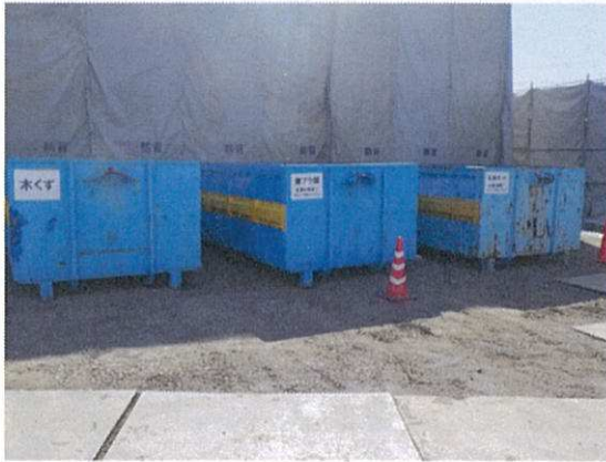
産業廃棄物の分別