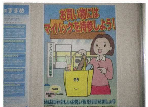
買い物袋持参 啓発活動