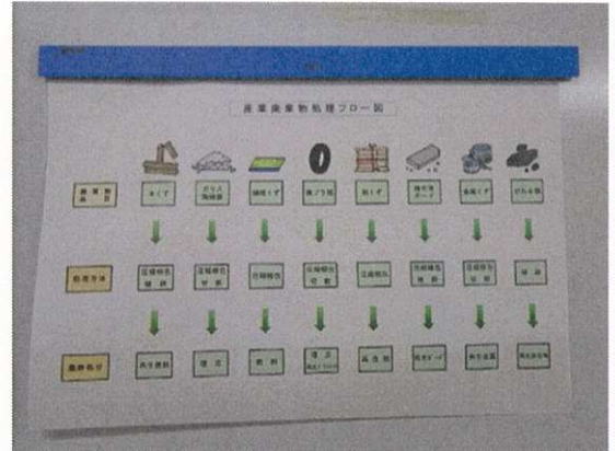
自社から出る廃棄物処理方法の周知