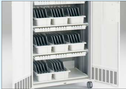
扉を開いたところ