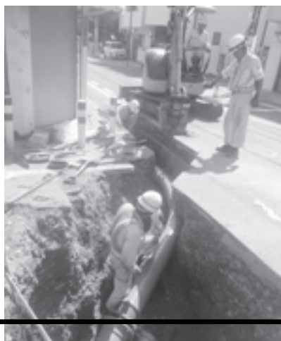
水道管の耐震化工事（安原地区）

の耐震化工事を完了しました。今後は、残りの水道管のほかに、災害対応病院や医療救護所へつながる水道管を優先的に耐震化していきます。