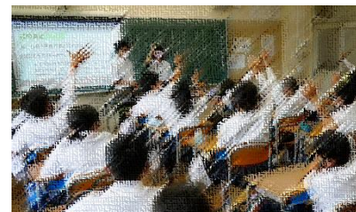
活発に意見を出し合う1年生

生徒が一生懸命考え、各クラスで決め出した「人権宣言」について、ご家庭でもぜひ話題にしてみてください。