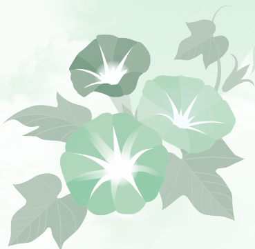
あさ がお 朝顔

暑い日に庭などに水をまく。水が気化するときに地表の熱をうばい地表面に接した空気も冷却される。