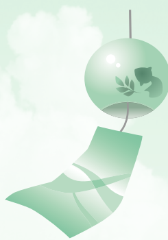
ふう りん 風鈴

ベランダなどにはわせた緑のカーテンで強い陽射しをさえぎり、見た目にも涼しさを感じさせる。二酸化炭素も吸収。