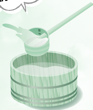
う みず 打ち水

暑い日に庭などに水をまく。水が気化するときに地表の熱をうばい地表面に接した空気も冷却される。