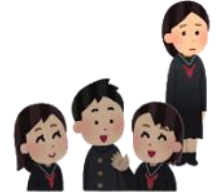
人間関係って難しい