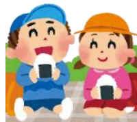
えんぞくたの 遠足楽しかった！