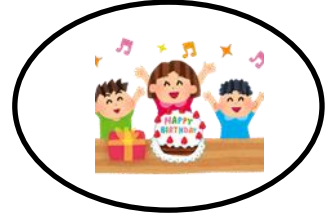
たんじょうび 誕生日だよ