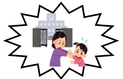
がっこうい 学校行きたくない