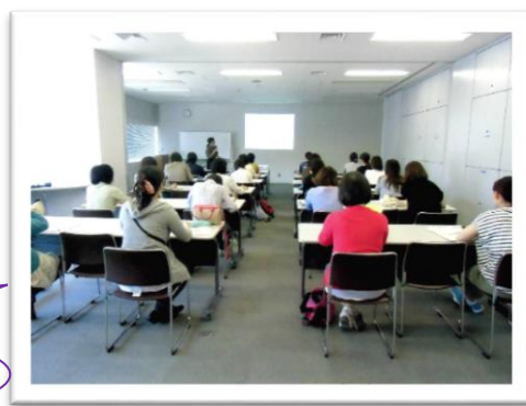
ネットワーク室での講座の様子