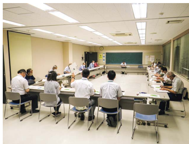
市民との意見交換（町会連合会）