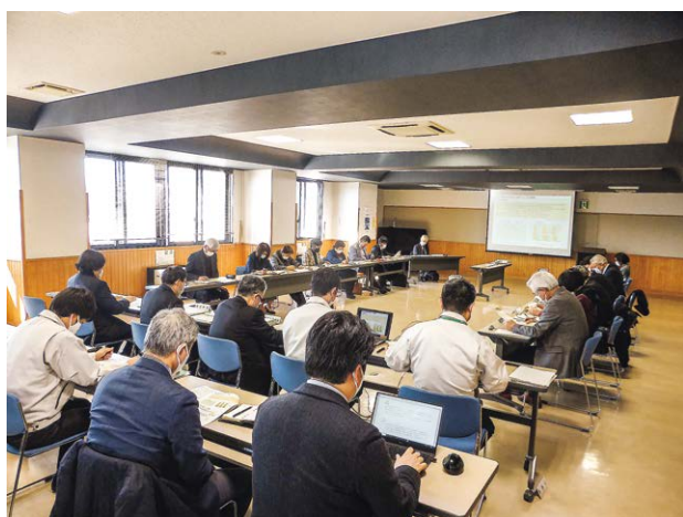
松本市都市計画策定市民会議