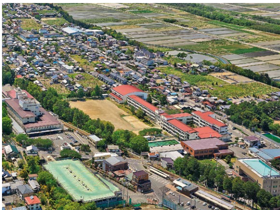
波田駅周辺（地域拠点）