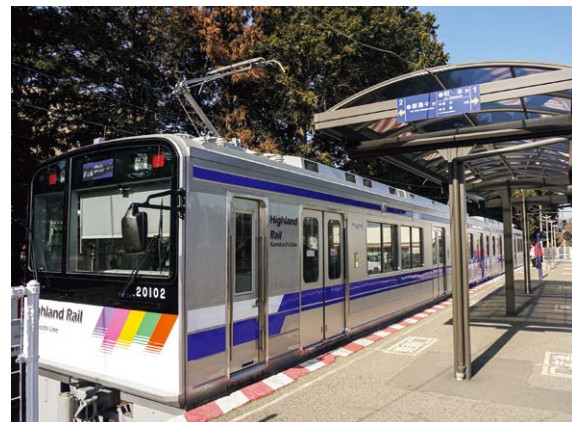
アルピコ交通上高地線