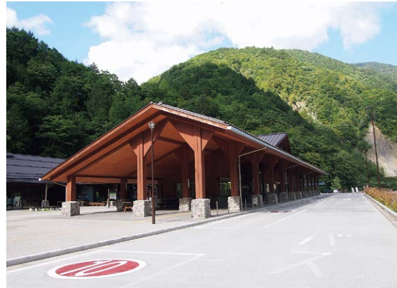
沢渡駐車場（バスターミナル）