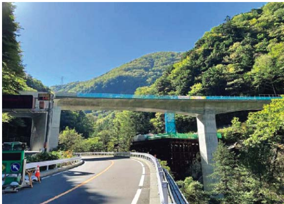
国道158号線（奈川渡改良）