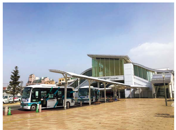
松本駅アルプス口駅前広場