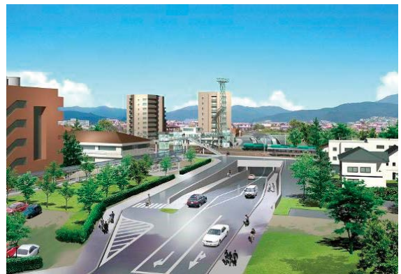
宮田前踏切の立体化事業（イメージ）