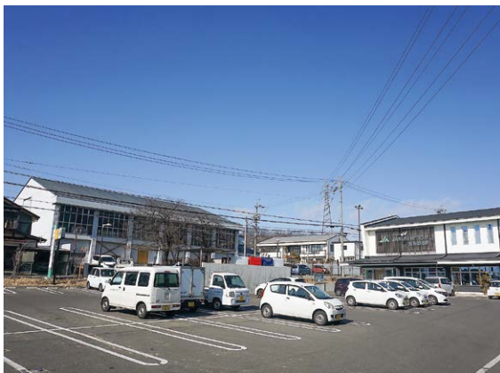
岡田地区地域づくりセンター周辺