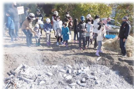
（子ども会育成会主催「焼き芋大会」）

今年度は、新型コロナウイルス感染症対策に留意しつつ、「白板地区をつなぐ！顔の見える関係づくり」にむけ、3部会それぞれの活動に取り組んできました。2月には各部会を開催する予定でしたが、感染症が急速に拡大したため、書面で委員の意見集約を行いました。