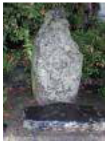
③ 中塔の道祖神 必見、年代不明