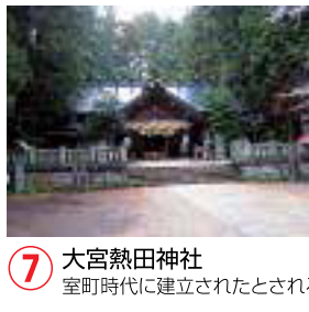
⑦ 大宮熱田神社 室町時代に建立されたとされる