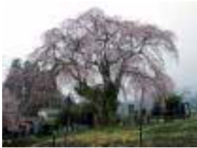
① 中塔のしだれ桜 幹周6.7m、樹高17m、樹齢800年