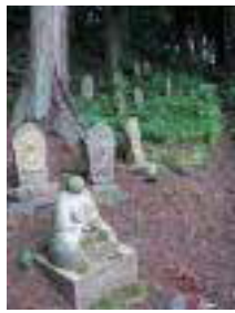
⑤ 七日山石仏群 七日山の頂上までの小道に88体の石仏群