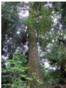
② 中塔のツガ 幹周4.7m、樹高30m、樹齢500年以上