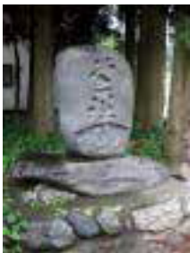
⑥ 小室の道祖神 1863年建立、扇形の中でお酒をかわす