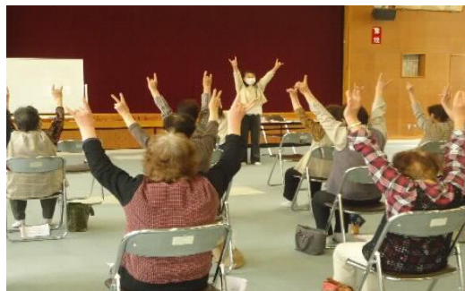
認知症サポーター養成講座のひとつコマ

定員になり次第締め切らせて頂きます。 問合せは梓川福祉ひろば(78-3000 内線 120)