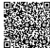
市ホームページ 「ワクチン接種に関する情報」