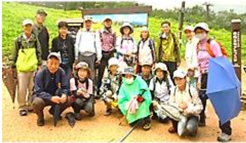
ひろばウォーキング バスハイク (白馬五竜)