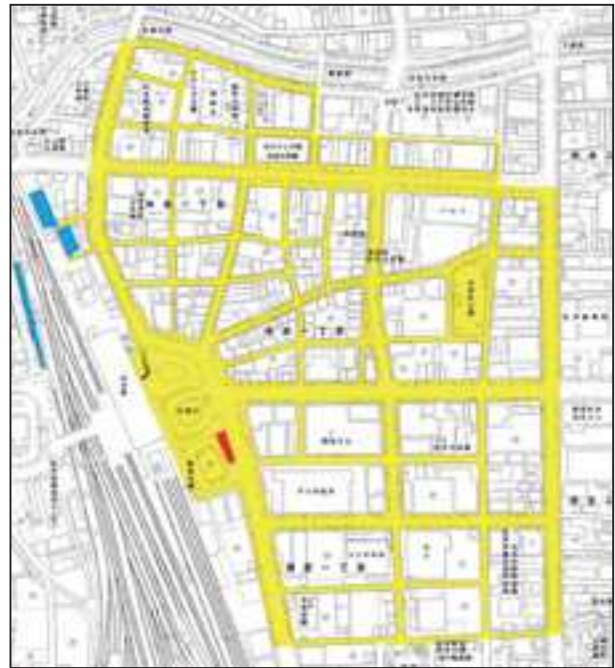
←自転車等放置整理区域

自転車を盗まれてしまったときは、速やかにお近くの交番または警察署に被害届を提出してください。