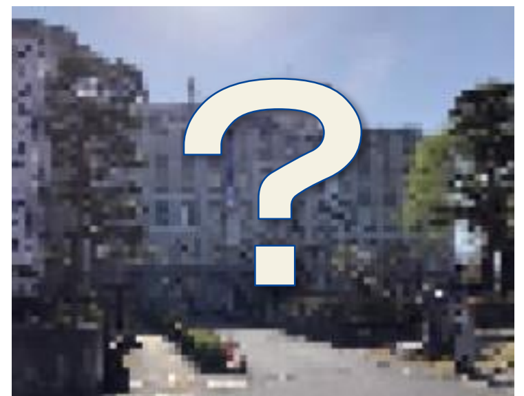
【三代目 松本市役所庁舎】 現地建替が決定