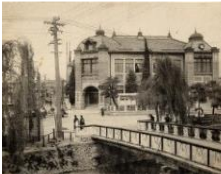
【初代 松本市役所庁舎】 1913～1959 大手4丁目4番(上土町)