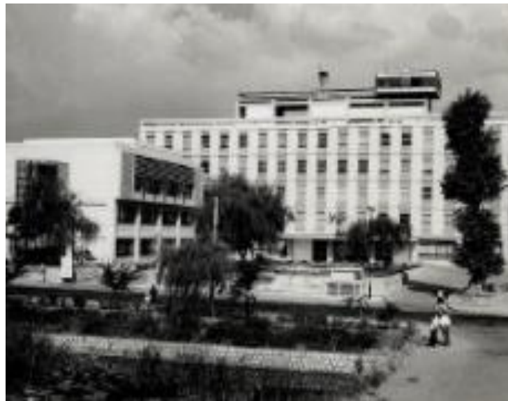
【二代目 松本市役所庁舎】 1959～ 丸の内3番7号に移転新築