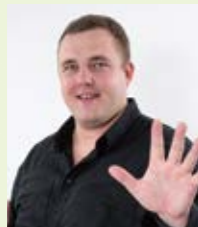
元大関 把瑠都 氏

1984年11月5日生まれ、エストニア出身。最高位は東大関。その外見から、「角界のディカプリオ」とも言われた。2013年に大相撲力士引退後は、タレント業を中心とした活動でテレビ、舞台など多方面で活躍中。豪快な食べっぷりから『食』の番組にも多数出演。