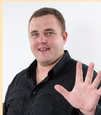
元大関 はろと 把瑠都氏