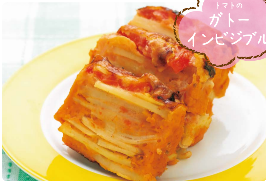
トマトの ガトー インビジブル