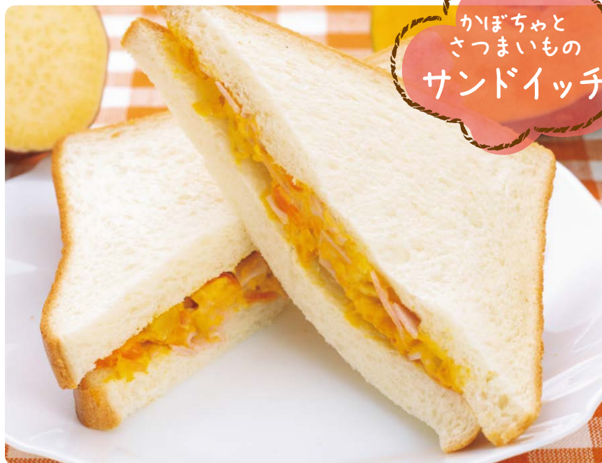
かぼちゃと さつまいもの サンドイッチ