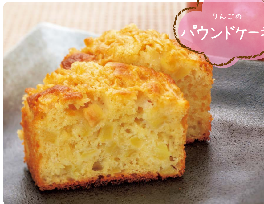
りんごの パウンドケーキ

家庭でミニトマトがたくさん採れたときにも、このレシピのようにひと工夫すれば、飽きずにおいしく食べられるゾウ。