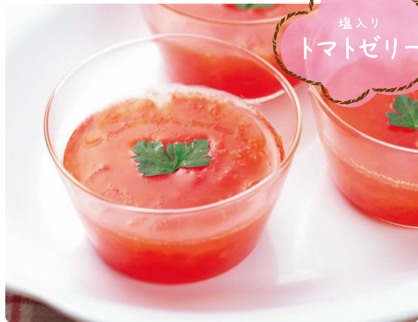
塩入り トマトゼリー