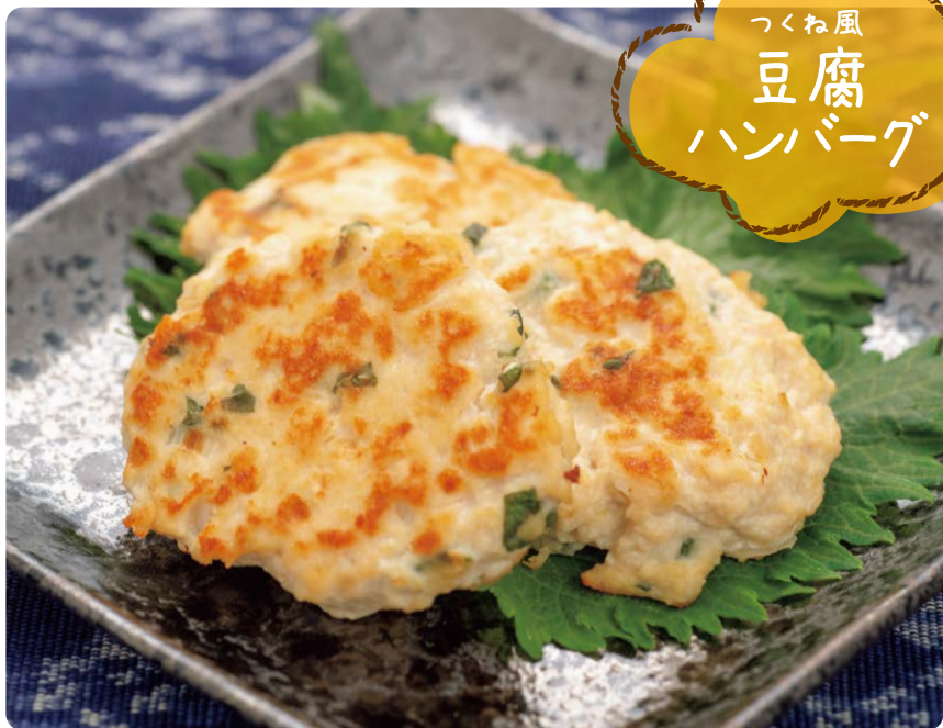
つくね風 豆腐 ハンバーグ