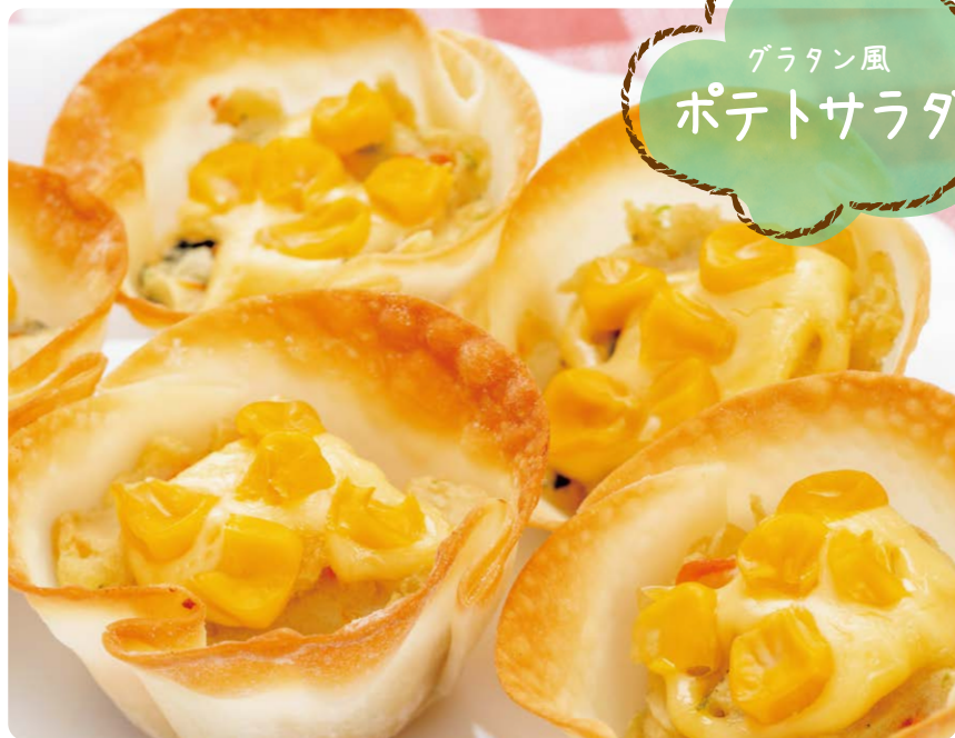
グラタン風 ポテトサラダ