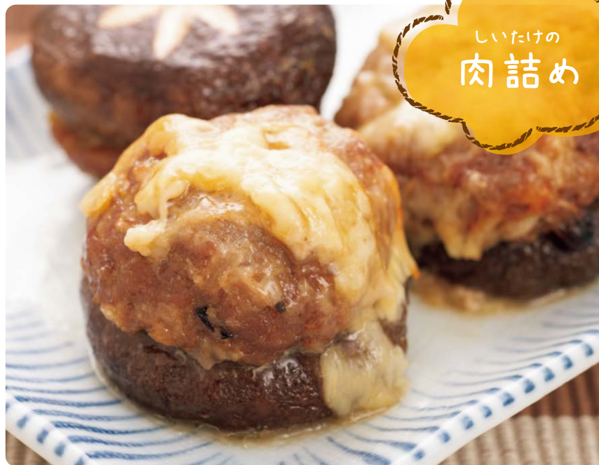
しいたけの 肉詰め