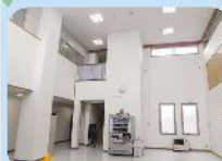
照明のLED化、内装の改修