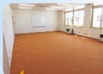
リビングはカーペット畳の併用