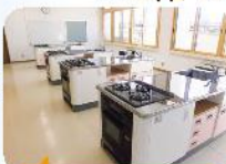
オープン付の調理台に更新