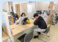
出迎室窓口のローカウンター化