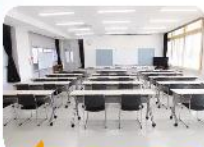
会議室のテーブルを更新

そのほかにも、自動ドア化、段差の解消、二重サッシ窓の設置、冷暖房設備の改修、文庫ホールにキッズベースを設置、太陽光発電設備の設置、外壁・屋根の改修、多目的ホールの吊り天井撤去などの様々な改修が「建築物の耐久性能向上と資産保持」「ユニバーサルデザイン」「エコ改修」を主な目的に行われました。平成29年度は残念ながら中止になってしまった文化祭も再開されますので、新しくなった笹賀公民館に皆さんぜひお越しください！