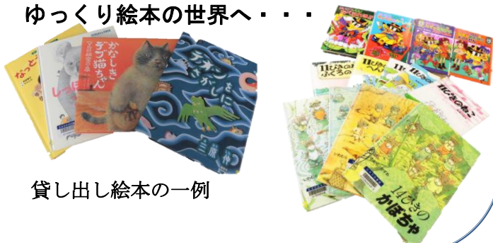
貸し出し絵本の一例

～絵本、短い時間で別世界～ 読書で秋の夜長を楽しんでみませんか？ 今回は絵本を多めに借りてきています。 子どもはもちろん、大人の気分転換にも！ ページをちょっと開いてみてください。 ゆっくり絵本の世界へ・・・