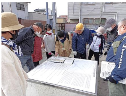
（水めぐりウォーク～城の南側編）