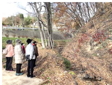
（防災ウォーク～兎沢川編）