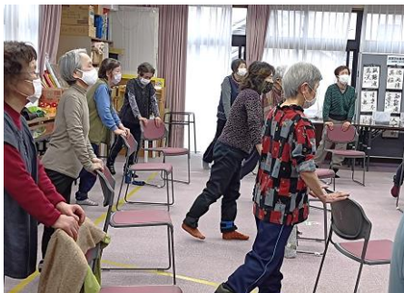
（いきいき百歳体操～福祉ひろば）

「生活していくうえで困っている」「困っている人のお手伝いをしたい」など、地区の困りごと、心配ごとなどがありましたら、お気軽にご相談ください。