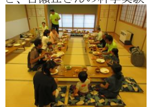
8月19日食事会のようす

10月28日(土)に行われる、松本市中心図書館の図書館まつり講演会・上映会に共催しています。詳しくは中央図書館までお問い合わせください。