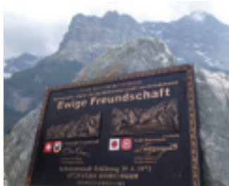
両市の友好関係を示す銘板