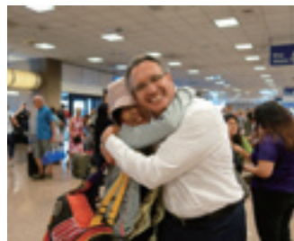
再会を喜ぶホストファミリー