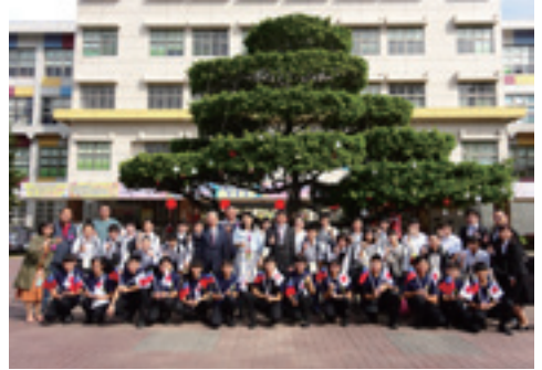
2020.1.7 高雄市立大仁国民中学校を訪れた松本市教育訪問団