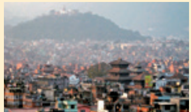
カトマンズ市街の眺望