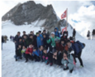
中学生ホームステイ事業(2018)