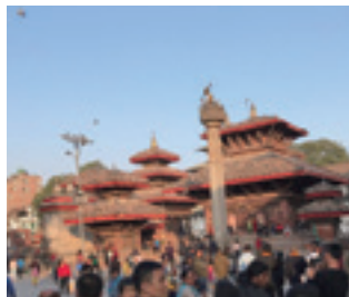
ジャガナート寺院(ダルバール広場)