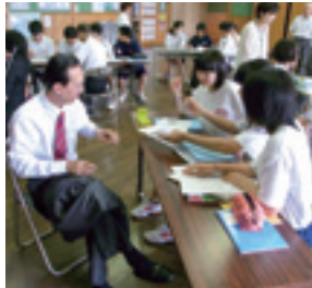
廊坊市教育訪問団が清水中学校へ訪問 (2012)