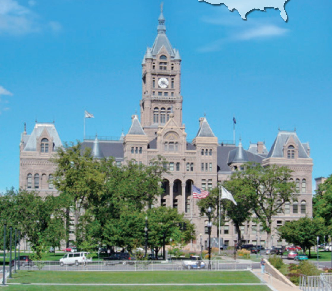
ソルトレーク市庁舎