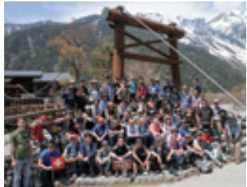
上高地を訪れたグリンデルワルト村の中学生(2019)