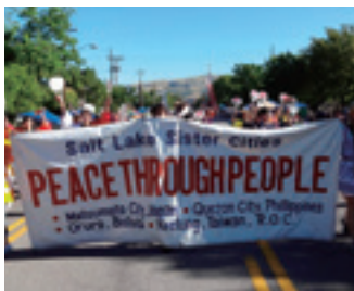
パイオニア(開拓者)パレード