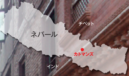
カトマンズ市の路地裏