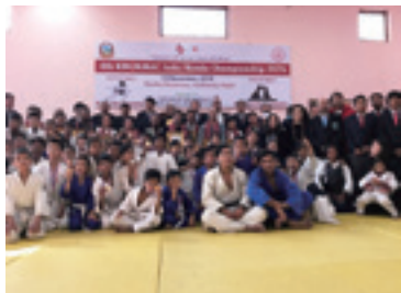
武道館にて開催された柔剣道大会の選手たち(2019)