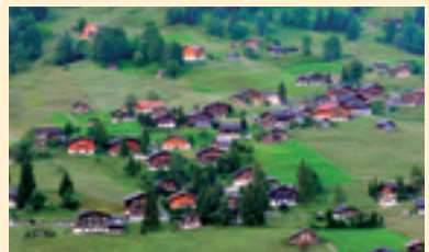
グリンデルワルト村