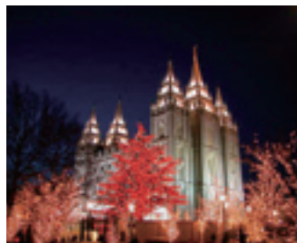
末日聖徒イエス・キリスト教会の神殿