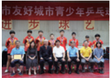
日中友好都市中学生卓球交歓大会 (2019)