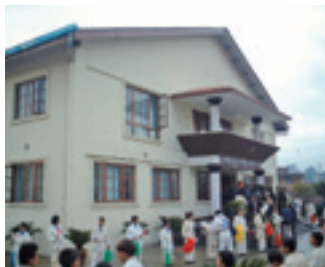
姉妹提携10周年を記念して建てられた武道館