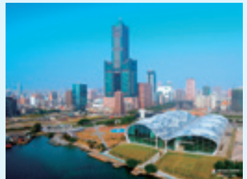
高雄市のシンボルである高雄85ビル