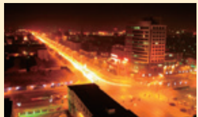
廊坊市の夜景