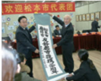
友好提携20周年 第二中学校訪問 (2015)