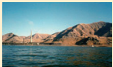
グレートソルトレーク