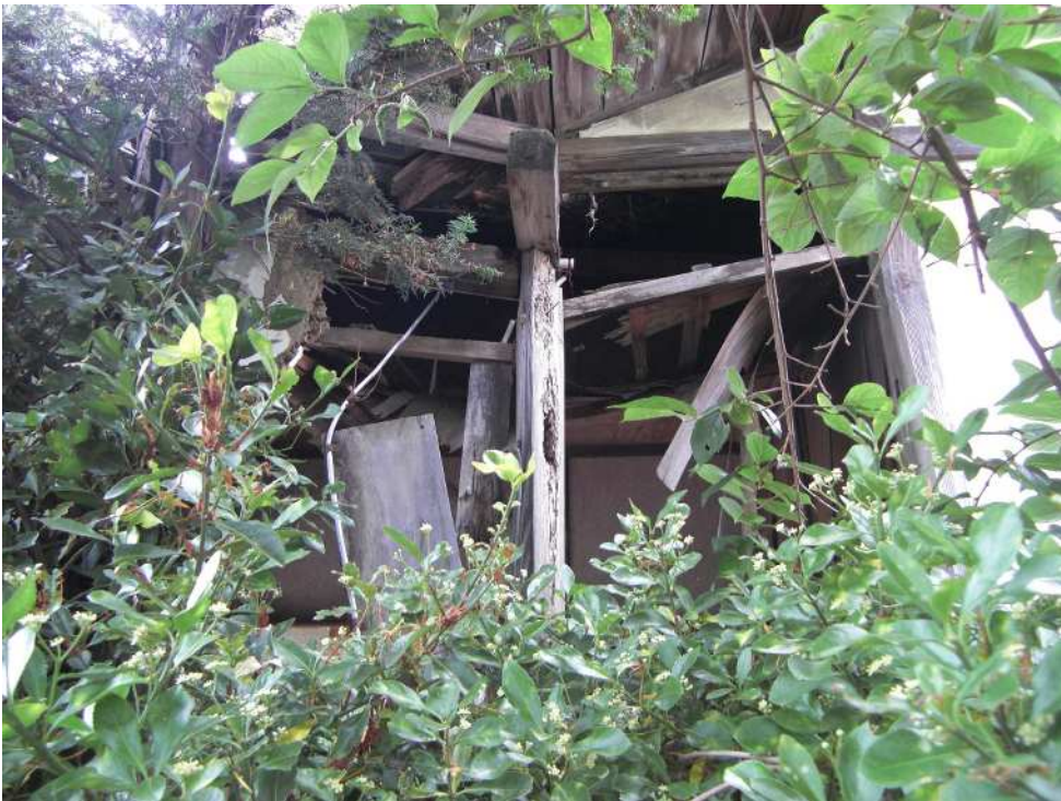
老朽化が進行し、柱及び外壁が崩れた部分。(隣家側から撮影)