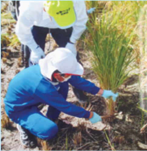
山辺小学校の稲刈り体験の様子