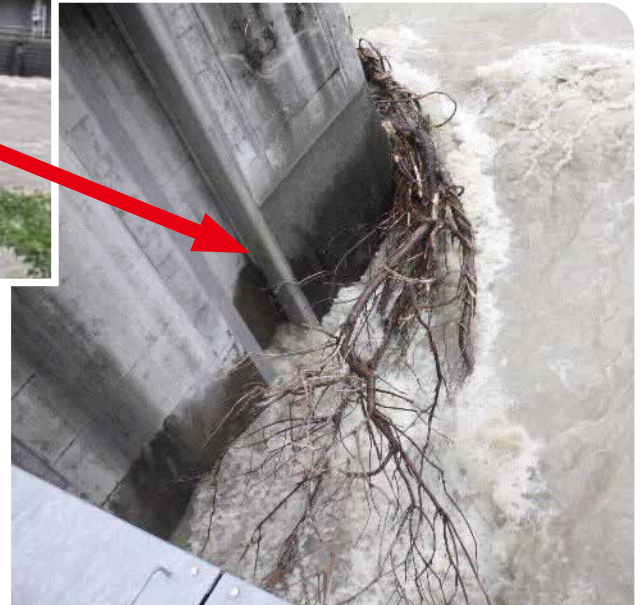
梓川頭首工 とうしゅこう に流木被害の様子