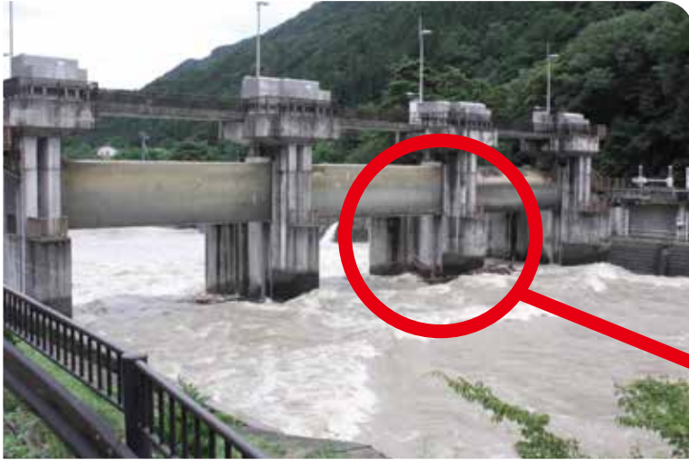
令和3年8月15日の梓川頭首工 とうしゅこう ※ (左上、右下の写真)