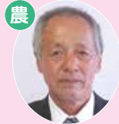
島立 瀨 博 農業振興委員会