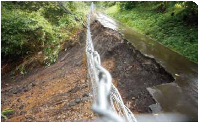
左下の写真 奈川地区の農道の崩落現場