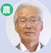
農 本郷 柳澤 一向 農業振興委員会